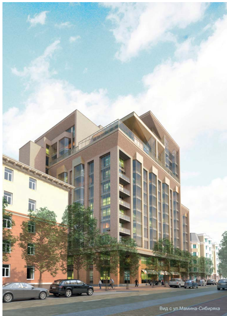
Вид с ул. Мамина-Сибиряка