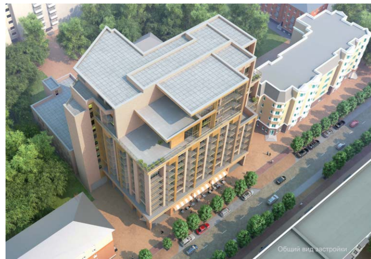
Общия вид застройки