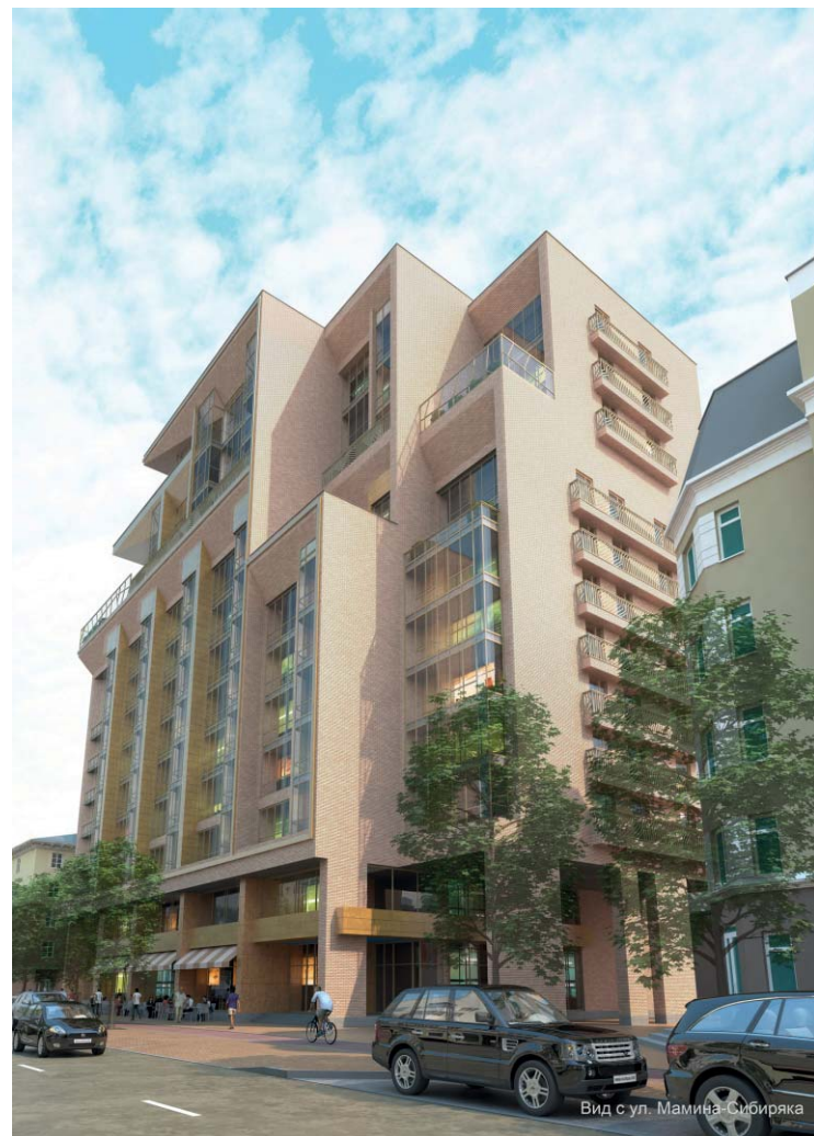
Вид с ул. Мамина-Сибиряка