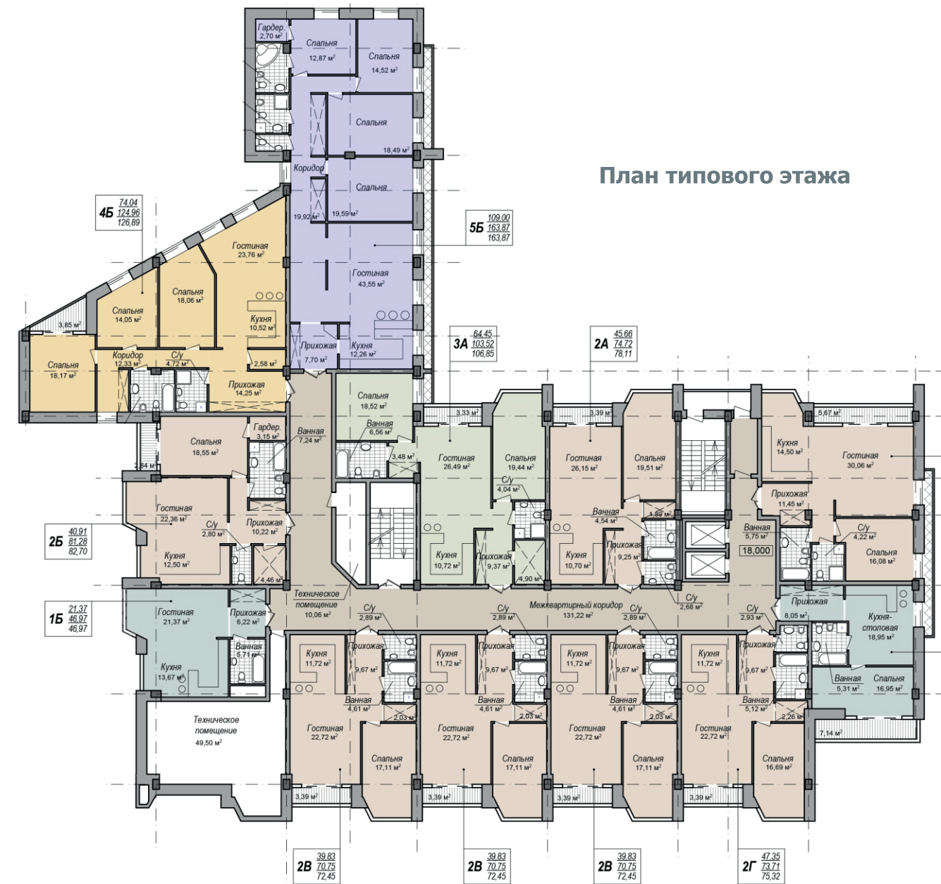
План типового этажа